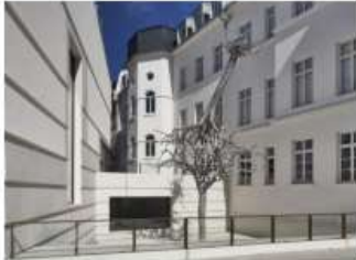
Ariel Schlesinger – Untitled (2018)

In diesem Jahr lädt die Arbeitsgemeinschaft Christlicher Kirchen (ACK) Andernach ein zur Besichtigung des Jüdischen Museums in Frankfurt am Main. Es gibt zwei parallele Führungen um 11:30 Uhr. Die Dauer beträgt 90 Minuten. Die erste Führung heißt „Tradition und Ritual“, die zweite „Was bedeutet es, jüdisch zu sein? – drei Frankfurter Familien“.